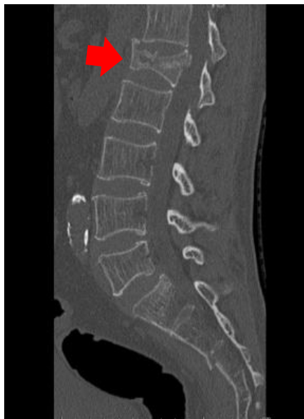
腰椎圧迫骨折 矢状断像